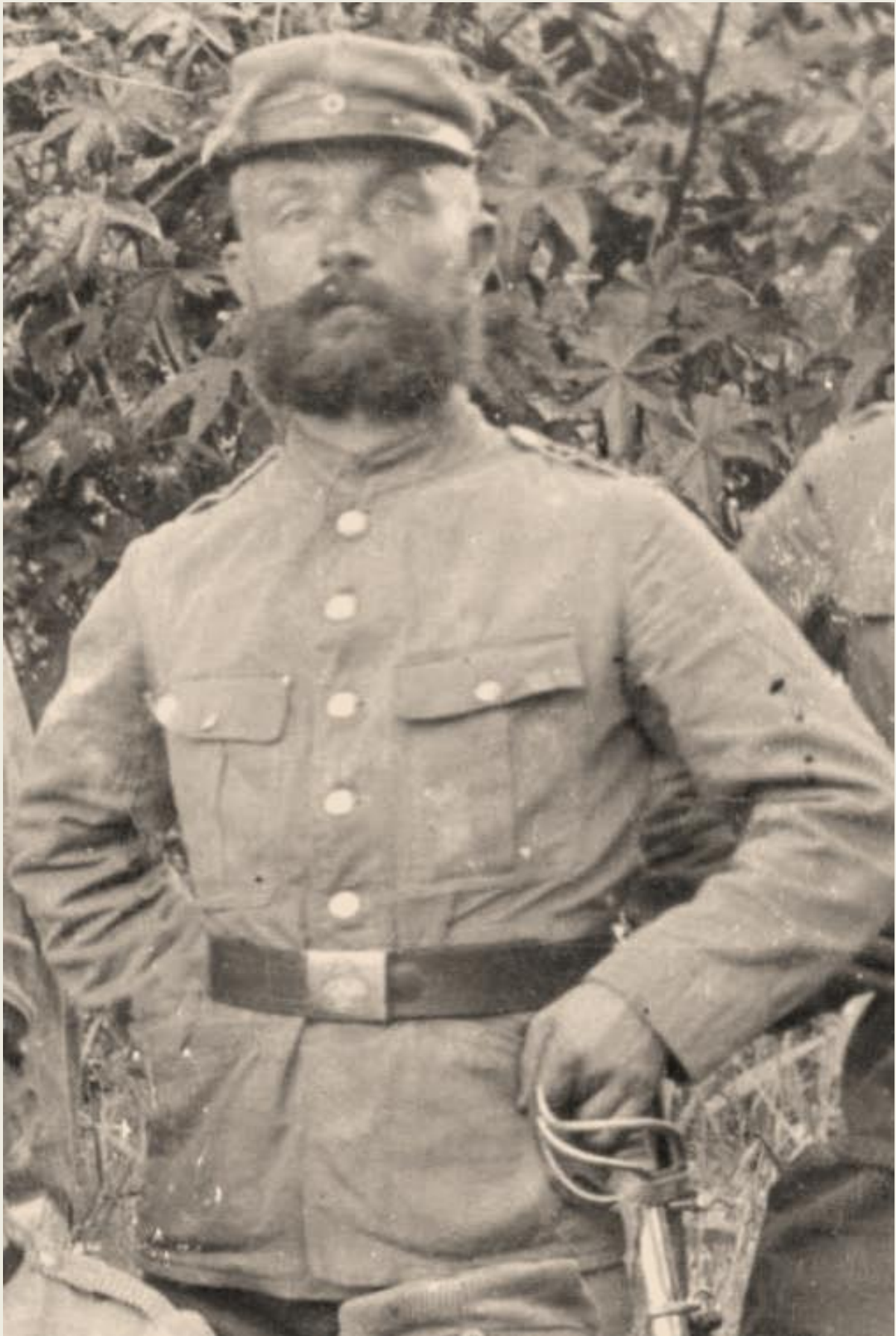
Unteroffizier der Schutztruppe DSW mit dem Säbel, 1883. 38