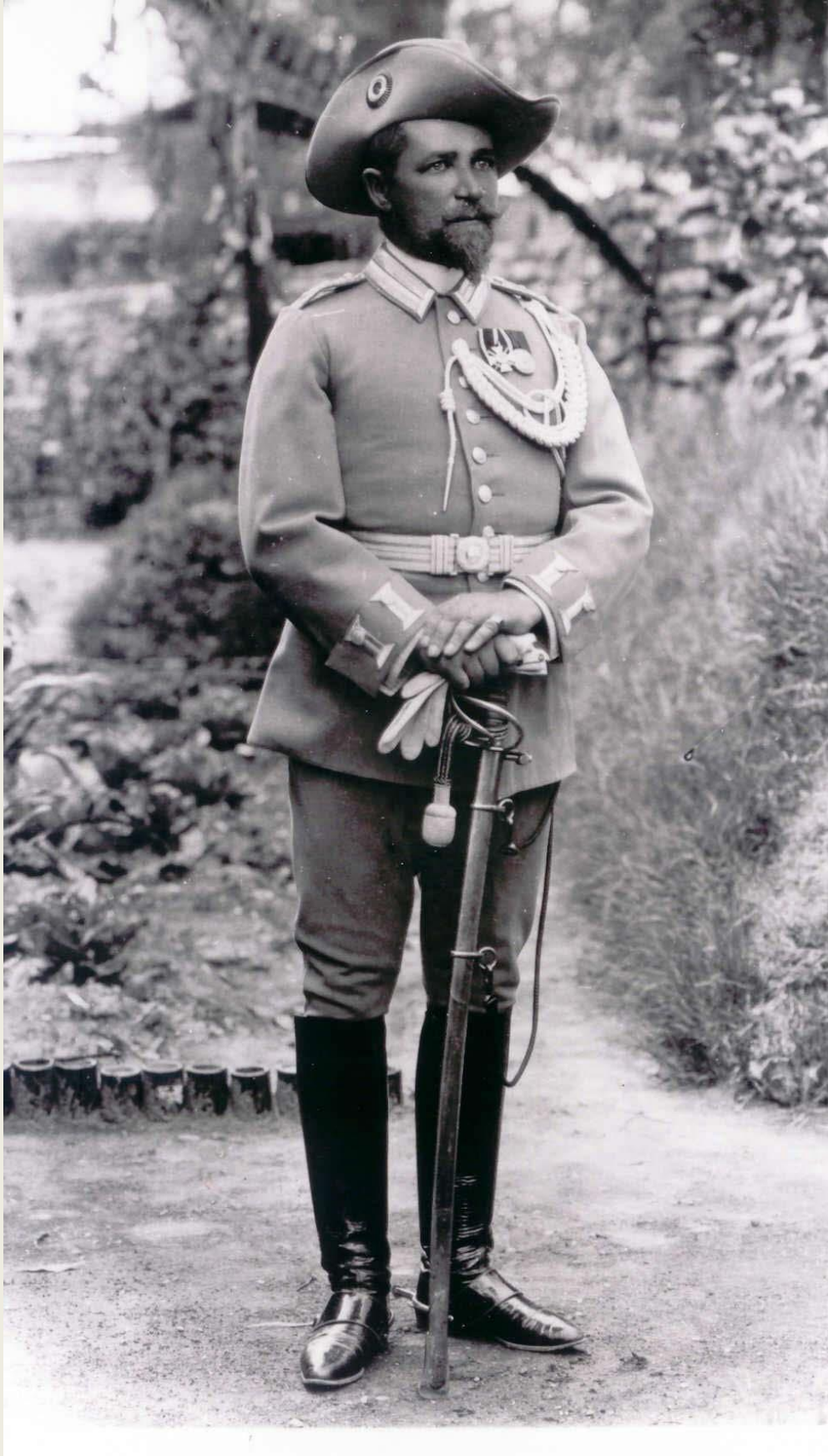
Hauptmann der Schutztruppe DSW mit dem Säbel für berittene Infanterie-Offiziere. 39