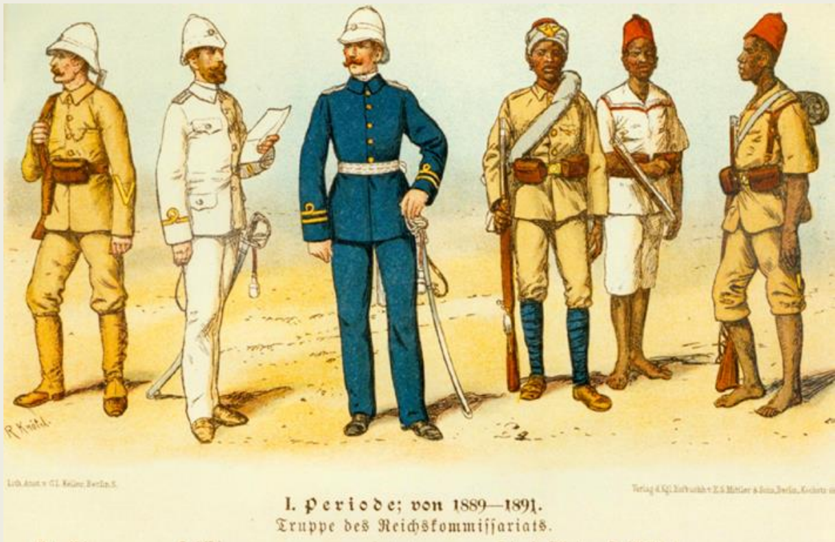
Kaiserliche Schutztruppe für Deutsch-Ostafrika 30