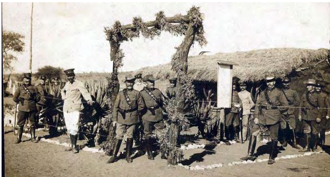
Die Landespolizei auf der Landesausstellung in Windhuk 1912. Im Hintergrund das in 2 Tagen erbaute Stationshaus