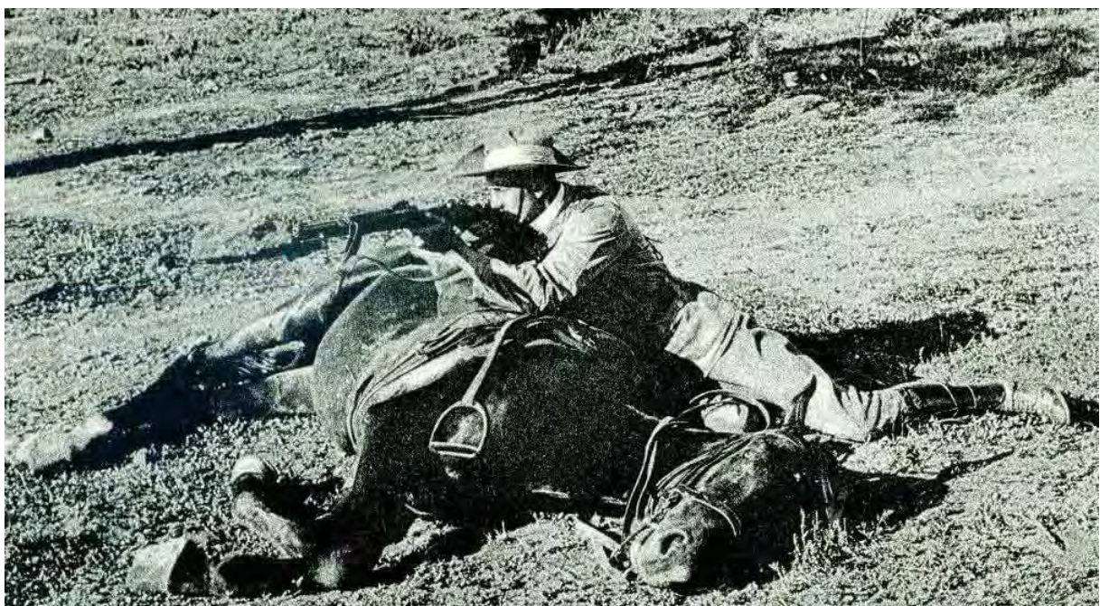
Pferdeausbildung: Schießen aus der Deckung mit einem Mauser Kavallerie-Karabiner M/98

Ab 1907 wurde die Landespolizei personell erheblich verstärkt. So dürften ihr bei Beginn des Ersten Weltkrieges annähernd 500 Deutsche angehört haben. Die benutzten Quellen widersprechen sich diesbezüglich, vermutlich sind Soll- und Ist-Bestand verschieden interpretiert worden. Die Einführung des hier beschriebenen Säbels dürfte um das Jahr 1905 erfolgt sein. Bei den „Bestimmungen des Gouverneurs von Südwestafrika, betreffend die Organisation der Landespolizei für die deutsch-südwestafrikanischen Schutzgebiete vom 1. März 1905“ wird als Anlage genannt: "Der Säbel ist ein leichter Kavallerie-Säbel in Lederscheide, von der Farbe des Koppels an langen, gleichfarbigen Ledertrageriemen.“ Hierbei dürfte es sich um das Säbelmodell der preussischen Polizeiwachtmeister gehandelt haben. Dementsprechend an der Lederscheide vermutlich ein Mund-, Mittel- und Ortblech aus Tombak, die beiden ersten mit einer angelöteten Ringöse und Tragering. Wann und ob diese Lederscheide durch eine Stahlblechscheide ersetzt wurde, ist nicht feststellbar. Offen bleibt, ob diese Säbel mit Lederscheide überhaupt eingeführt wurden, bzw. es zu einem späteren Modellwechsel bzw. zum Auswechseln der Scheiden überhaupt kam. Lederscheiden an langen Griffwaffen weisen nur eine geringe mechanische Festigkeit gegenüber Stahlscheiden auf. Deshalb fanden Lederscheiden bei Berittenen auch kaum noch Verwendung.