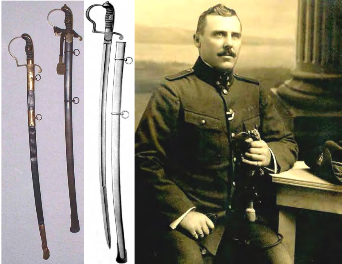
Links: Säbel der preussischen Polizeiwachtmeister (links) und der Landespolizei.